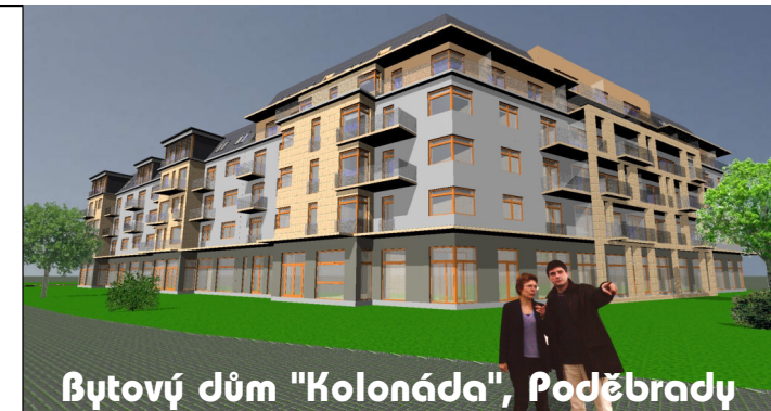
Bytový dům "Kolonáda", Poděbrady